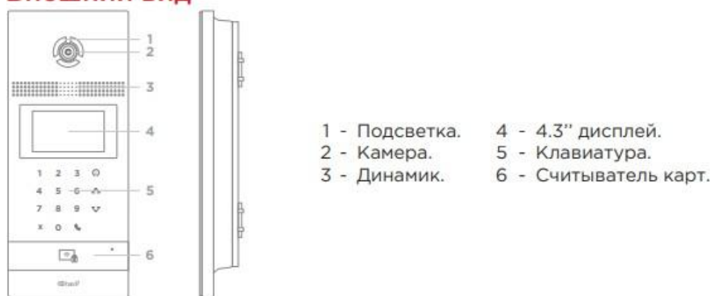
Рис. 5. Внешний вид и органы управления блока «BAS-IP UKEY».