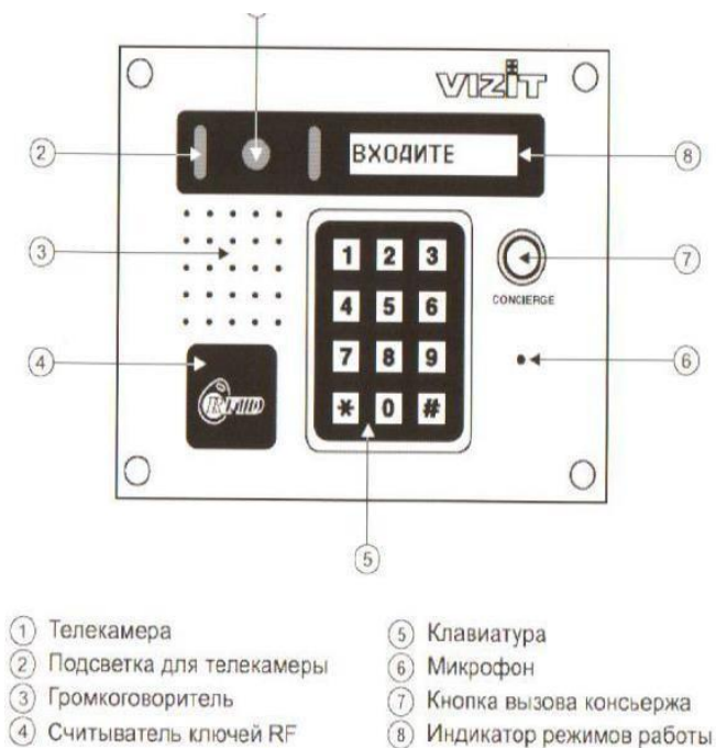
Рис. 5. Внешний вид и органы управления блока «VIZIT».